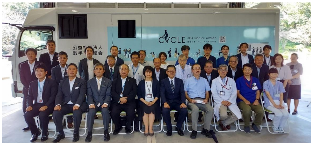
※来賓・出席者の方々

この検診車の稼働により胸部検診活動が更に充実し、地域住民の方、事業所にお勤めの方など多くの皆様方に、より質の高い医療サービスを提供できるようになります。弊会は今後も地域の健康増進に貢献してまいります。