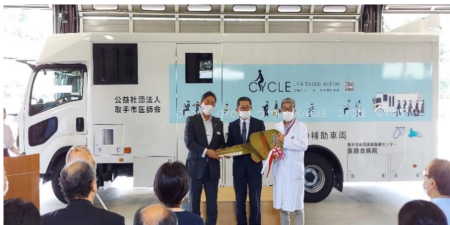
※レプリカキー贈呈

検診車の稼働に先立ち、2024 年 9 月 6 日(金)に医師会病院の検診車庫内で納車式典を開催いたしました。式典には取手市、守谷市、利根町の行政機関の方をはじめ、(株)メディセオ様、富士フィルムメディカル(株)様、京成自動車工業(株)様、いすゞ自動車(株)様など多くの関係者にご出席くださいました。また、取手市医師会の正副会長、取手北相馬保健医療センター医師会病院の正副院長ほか、多くの内部関係者も出席いたしました。